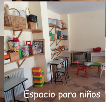
Espacio para niños