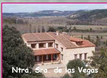
Ntra. Sra. de las Vegas